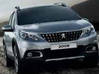
SUV PEUGEOT 2008