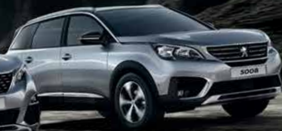
SUV PEUGEOT 5008