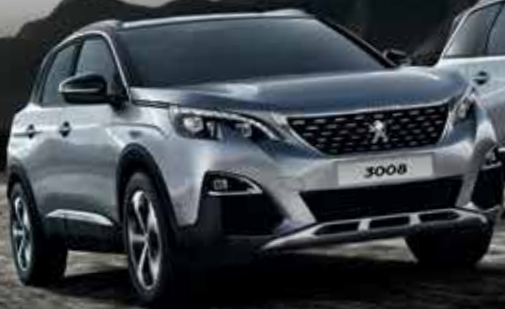
SUV PEUGEOT 3008