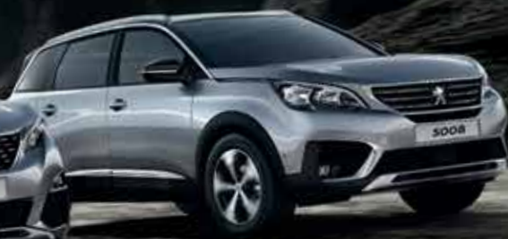
SUV PEUGEOT 5008