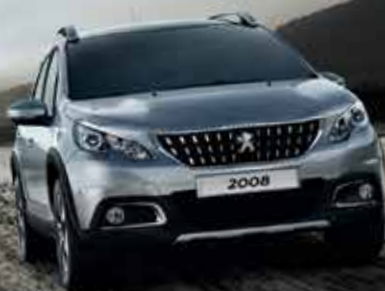
SUV PEUGEOT 2008