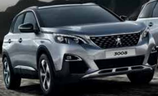
SUV PEUGEOT 3008